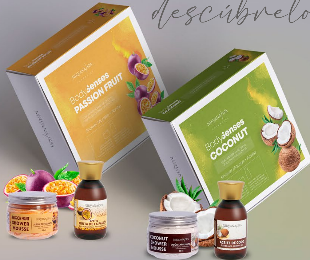
BODYSENSES FRUTA DE LA PASIÓN