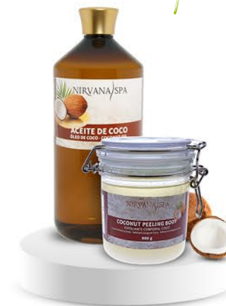
Peeling body 800 g. Aceite de masaje 1 litro.