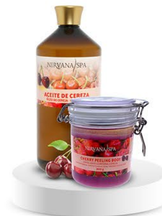
Peeling body 800 g. Aceite de masaje 1 litro.

¿Te gustaría disfrutar de todos los Rituales Spa en casa?