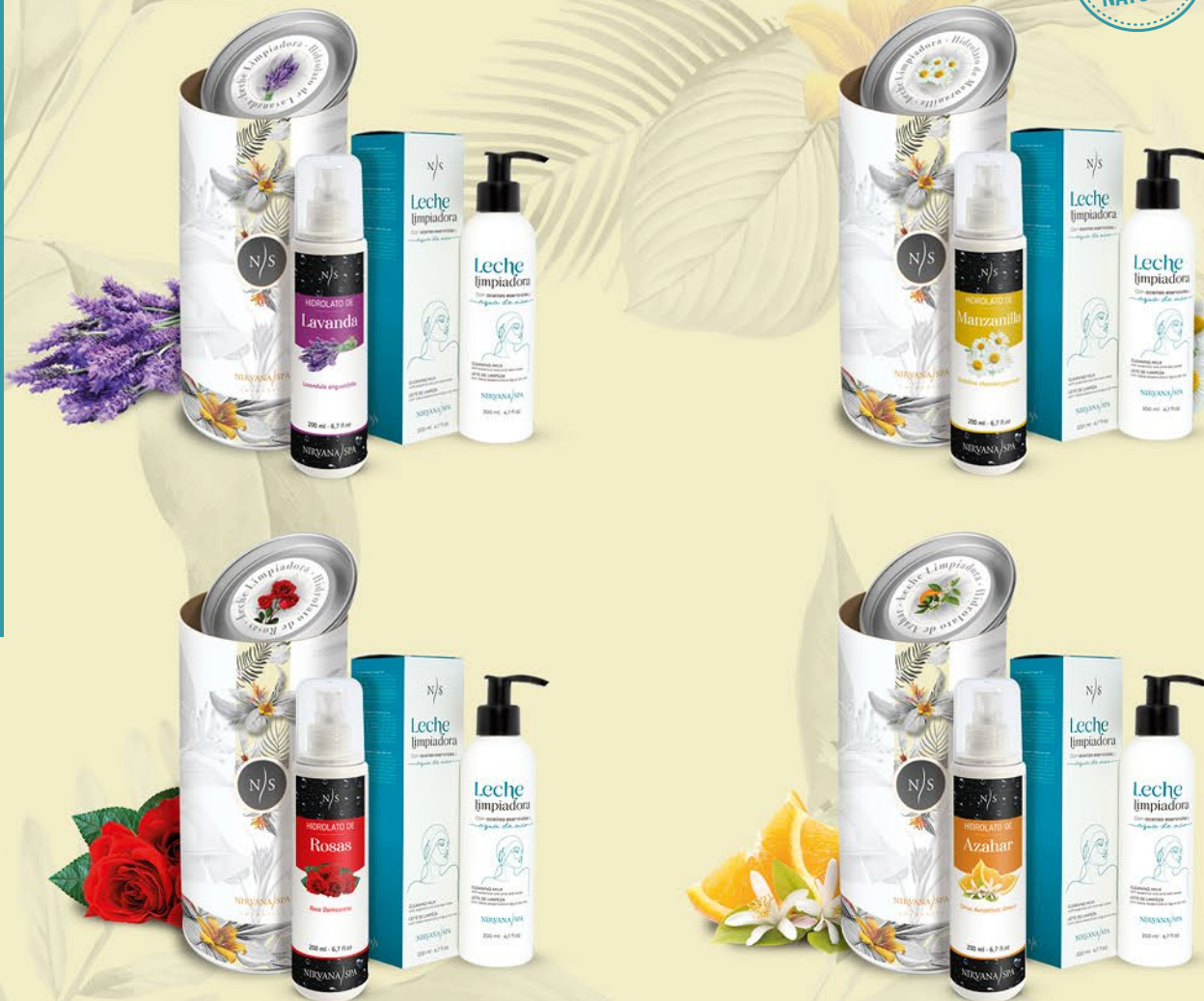
Presentación Estuche Roll Deluxe