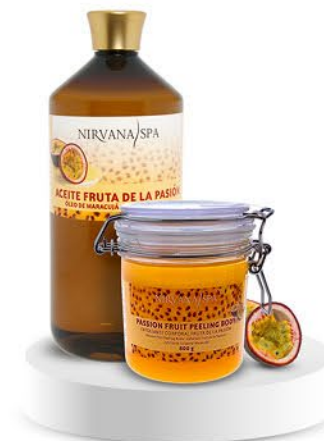
Peeling body 800 g. Aceite de masaje 1 litro.