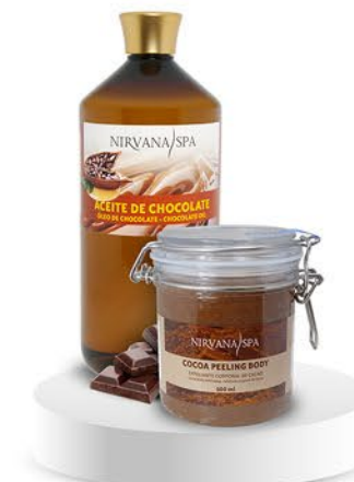
Peeling body 500 ml. Aceite de masaje 1 litro.